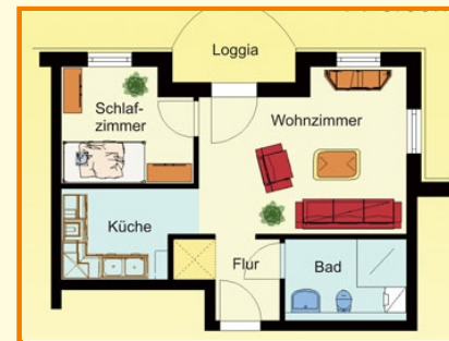
Beispielwohnung für 1 Person 45,33m 2